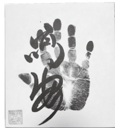
●力士直筆サイン例